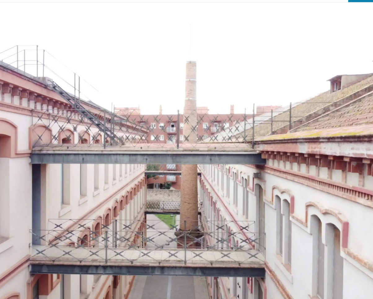
Can Marfà. Museu de Mataró.

SÍMBOL DE LA IDENTITAT PRODUCTIVA DE LA CIUTAT.